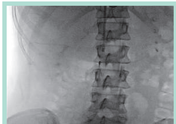
FIGURE 1 : Contrôle radiologique du filtre cave.

Le filtre cave a été positionné sous contrôle scopique dont le pôle proximal a été positionné en projection du bord inférieur de la vertèbre L2 en dessous de l'abouchement des veines rénales ( Figure 1 ). Il n'y a pas eu de complications au moment du largage avec un contrôle satisfaisant du positionnement du filtre.