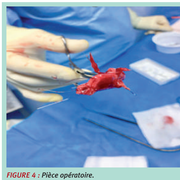
FIGURE 4 : Pièce opératoire.

En cas de contre-indication ou de complications liées à l'anticoagulation, la solution qu'offrent les filtres caves permet souvent d'éviter la survenue ou la récurrence d'embolie pulmonaire.