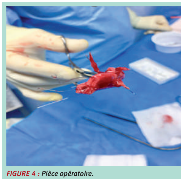
FIGURE 4 : Pièce opératoire.

En cas de contre-indication ou de complications liées à l'anticoagulation, la solution qu'offrent les filtres caves permet souvent d'éviter la survenue ou la récurrence d'embolie pulmonaire.