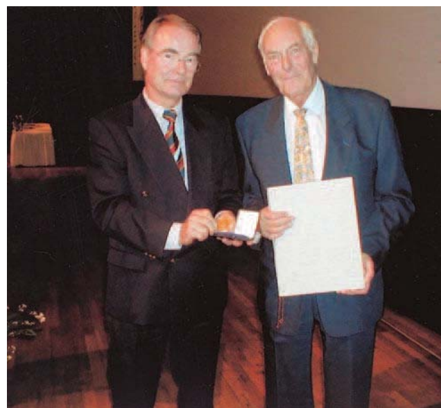
Fig. 1. – Urs Brunner recevant la médaille Max Ratschow (Nuremberg – 2003)

L'œuvre écrite d'Urs Brunner est considérable : aux 330 publications de langue Allemande concernant les artères, les veines, les lymphatiques, les plaies, viennent s'ajouter 32 publications de langue française présentées pour la plupart à la tribune de la Société Française de Phlébologie ou à celle du Collège Français de Pathologie Vasculaire. Le 6 novembre 1999 avait été organisé à l'Hôpital Universitaire de Zurich un colloque en l'honneur d'Urs et auquel je fus invité en ma qualité de Président de l'Union Internationale de Phlébologie. Ce fut pour moi l'occasion d'insister sur la contribution importante d'Urs à la phlébologie francophone car il sut établir le lien nécessaire entre la phlébologie de langue allemande et la phlébologie de langue française. La part éminente qu'il avait prise à la vie de la Société Française de Phlébologie et à celle du Collège Français de Pathologie Vasculaire m'incita à centrer mon exposé sur l'analyse exhaustive de la bibliographie francophone d'Urs Brunner, démontrant ainsi que son insigne mérite avait été de jeter un pont entre deux cultures tant au plan relationnel qu'au plan scientifique, surtout que germanophones et francophones ont beaucoup à se dire mutuellement et malheureusement se trouvent souvent séparés par l'obstacle linguistique. Aussi me permettrai-je ici de rappeler le déroulement méthodique de ses publications de langue française.