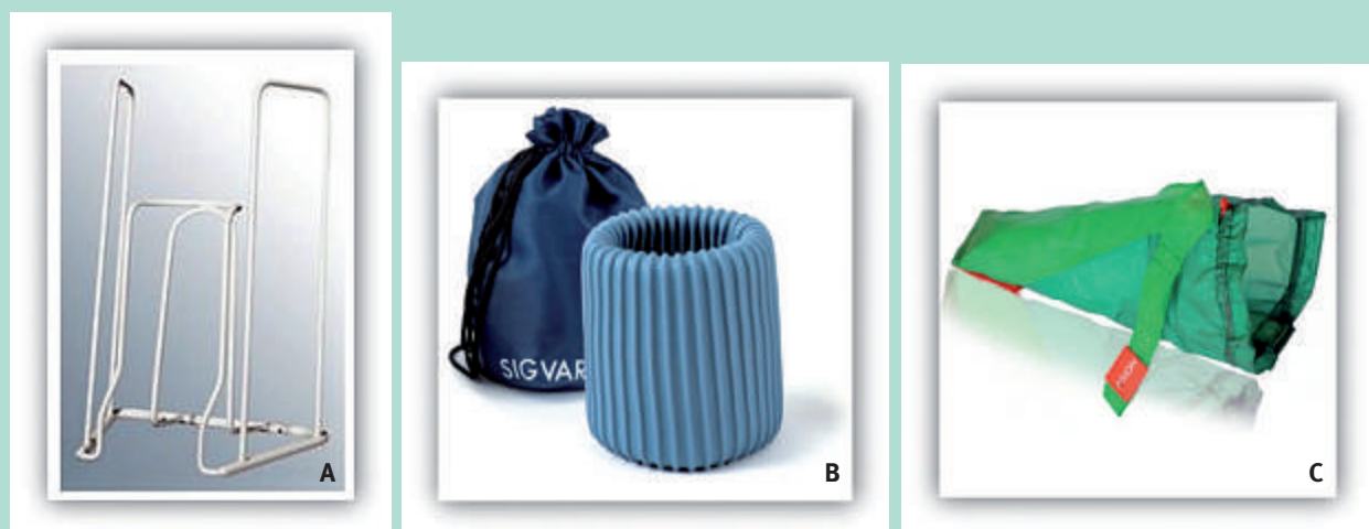
FIGURE 1 : Enfile-bas utilisés pour l'étude. (A) Enfile-bas rigide (MEDIVEN) ; (B) Enfile-bas souple « Rolly » (SIGVARIS) ; (C) Enfile-bas souple « parachute » (Arion Magnide, JUZO).