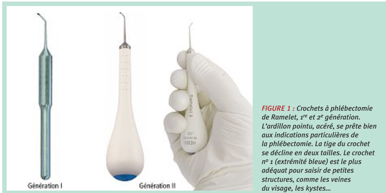
FIGURE 1 : Crochets à phlébectomie de Ramelet, 1 re et 2 e génération. L'ardillon pointu, acéré, se prête bien aux indications particulières de la phlébectomie. La tige du crochet se décline en deux tailles. Le crochet n° 1 (extrémité bleue) est le plus adéquat pour saisir de petites structures, comme les veines du visage, les kystes...