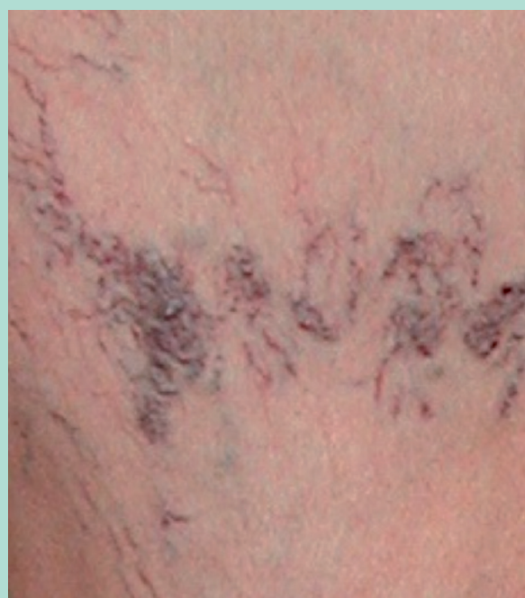
FIGURE 4 : Télangiectasies bleues de plus grand diamètre, pouvant se dilater au point de donner des perles de télangiectasies, à fleur de peau, à risque de rupture hémorragique.

Mon hypothèse personnelle est que les rouges pourraient être des télangiectasies plus jeunes , en pleine croissance stimulées par des facteurs angiogéniques ou inflammatoires comme dans le matting. La sclérothérapie n'élimine pas ces facteurs d'où une réduction de l'efficacité de la sclérothérapie.