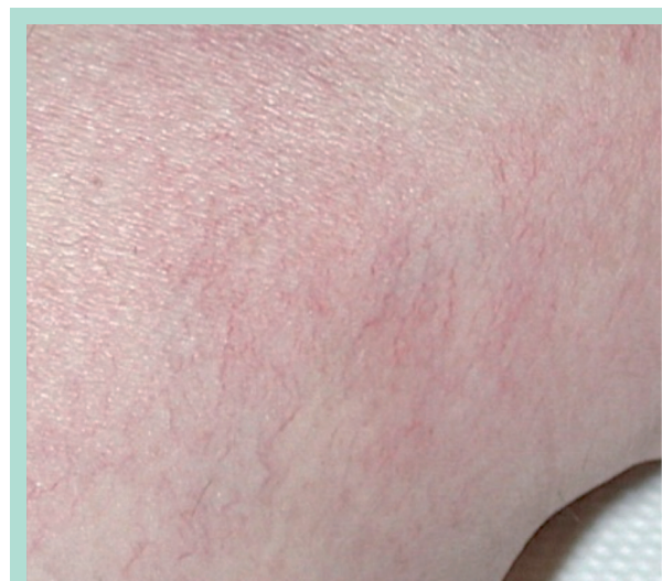
FIGURE 3 : Pour une raison encore inconnue, les fines télangiectasies rouges résistent plus au traitement.

Une différence de profondeur des télangiectasies dans le derme pourrait aussi expliquer en partie leur couleur (rouge plus superficiel), mais ceci n'a malheureusement pas été analysé dans cette étude.