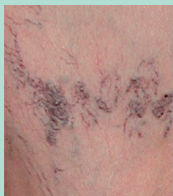
FIGURE 4 : Télangiectasies bleues de plus grand diamètre, pouvant se dilater au point de donner des perles de télangiectasies, à fleur de peau, à risque de rupture hémorragique.

Mon hypothèse personnelle est que les rouges pourraient être des télangiectasies plus jeunes , en pleine croissance stimulées par des facteurs angiogéniques ou inflammatoires comme dans le matting. La sclérothérapie n'élimine pas ces facteurs d'où une réduction de l'efficacité de la sclérothérapie.