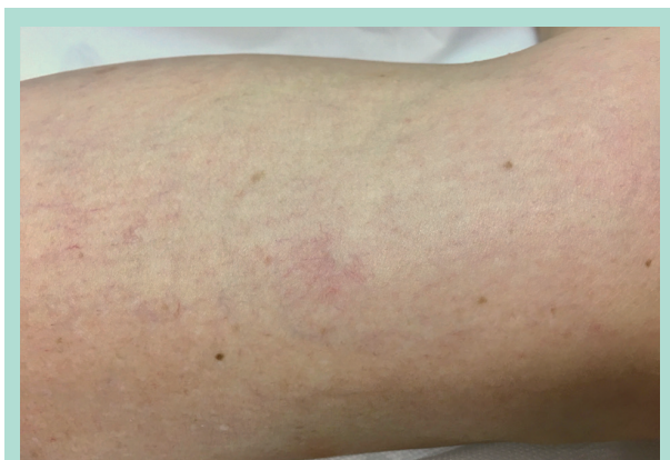
FIGURE 2 : Dans cet éclat de télangiectasies, lorsque l'on appuie avec un doigt au centre et qu'on le relâche, les télangiectasies se remplissent instantanément depuis le centre avec un flux centrifuge. Dans ces situations, je suis très prudent, la réponse thérapeutique peut être mauvaise. Ces télangiectasies pourraient être nourries par un micro-shunt ou une micro-perforante.

Bien que la présence de shunts artériolo-veineux pourrait expliquer certaines nécroses cutanées post-sclérothérapie, ce risque est infime (< 1 %).