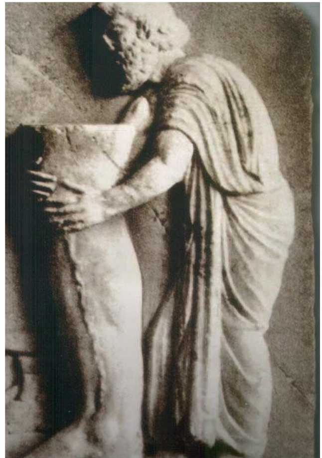
Fig. 1. – Les offrandes votives étant anonymes, la sculpture ne pouvait pas montrer le visage du fidèle. L'hypothèse de l'examen clinique est très suggestive : les doigts de Lysimachidis palpent une varice de la GVS, comme pour faire un diagnostic

Edwin Smith (1 500 av. J.-C.) traite de la thérapie des ulcères variqueux, en recommandant leur protection avec de la viande fraîche, du miel et du beurre (la Bible parle d'Isée qui les soigne avec des cataplasmes de figues).