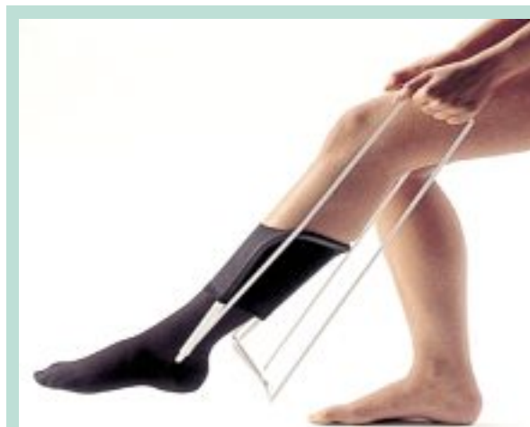
FIGURE 4 : Enfile-bas rigide.

Dans une étude publiée en 2006 [1] et réalisée chez 138 patients hospitalisés d'âge moyen 82,5 ans dont l'insuffisance veineuse était documentée à l'écho-Doppler, le port d'une compression élastique était nécessaire.