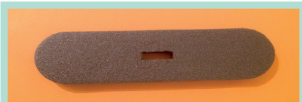
FIGURE 3 : Une fenêtre rectangulaire (30 mm / 10 mm) a été réalisée au sein de la partie rigide du dispositif.

Une fenêtre rectangulaire (30 mm / 10 mm) a été réalisée au sein de la partie rigide, ainsi qu'au niveau du rectangle de mousse permettant le passage d'une sonde d'échographie micro-convexe nécessaire aux mesures des diamètres et des profondeurs des varices ( Figure 3 ).