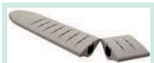
FIGURE 2 : Manchon utilisé pour les mesures