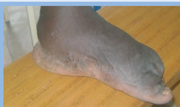
FIGURE 7 : Même pied que Figure 2, début juin 2009.