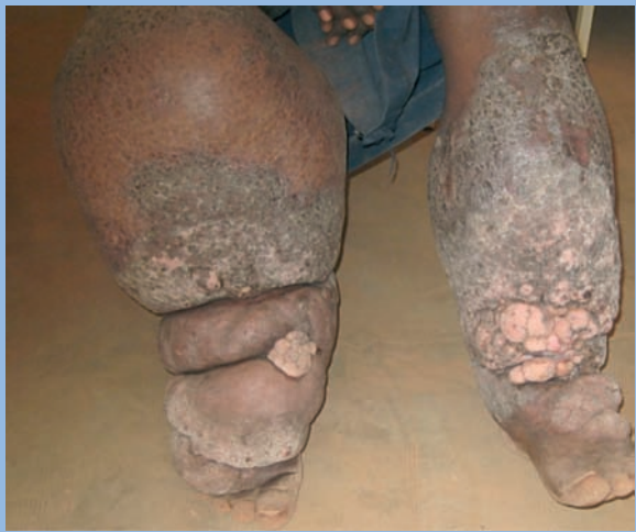
FIGURE 3 : Eléphantiasis bilatéral, prédominant à droite, chez un jeune de 20 ans, à qui on a proposé une amputation (prévue fin février 2009). Donnez une dimension du mollet gauche... Je ne pouvais en faire le tour avec mes bras !