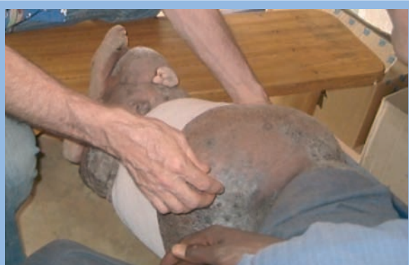
FIGURE 5 : Pose de la deuxième bande !

Un séjour humanitaire au Burkina-Faso. Une aide de la télé-médecine pour la phlé-