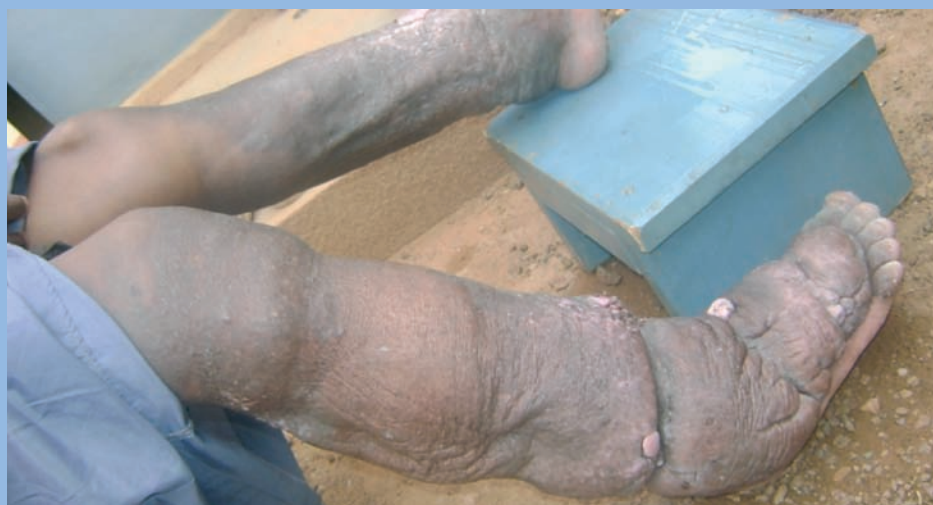
FIGURE 8 : Mêmes jambes que Figure 3. Amélioration particulièrement spectaculaire des deux côtés (photo début juin 2009).

Nous vous tiendrons informés de sa suite dans « Phlébologie Annales Vasculaires ».