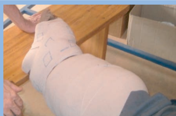
FIGURE 6 : Pose de la cinquième bande !