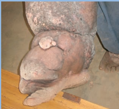
FIGURE 4 : Le pied de la même jambe ! Où est le gros orteil ?