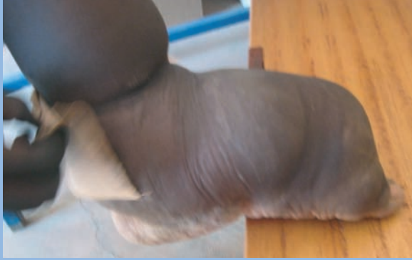
FIGURE 2 : Éléphantiasis pied gauche, pied droit normal.