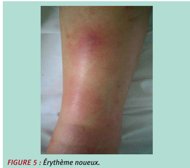
FIGURE 5 : Érythème noueux.

Elle est particulière car elle survient chez un sujet jeune, sans facteur de risque vasculaire associé.