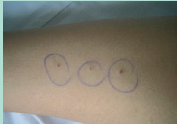
FIGURE 4 : Test pathergique positif.

Il s'agit d'une hyperréactivité cutanée aspécifique aux agressions de l'épithélium, survenant au niveau des points d'injection, des sites de perfusion, suite à des éraflures superficielles ou à des intradermoréactions.