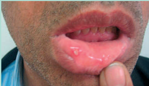
FIGURE 1 : Aphthose buccale.

Différents agents infectieux ont été étudiés et il en ressort que le Streptococcus sanguis serait l'agent pathogène le plus incriminé.