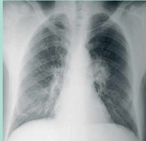
FIGURE 7 : Radio du thorax révélant un anévrisme pulmonaire.

Les anévrismes des artères pulmonaires (AAP) sont le plus souvent diagnostiqués à l'occasion d'hémoptysies répétées et d'abondance moyenne.