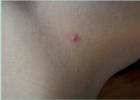
FIGURE 3 : Pseudo-folliculite du cou.