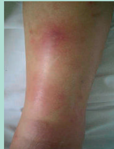
FIGURE 5 : Érythème noueux.

Elle est particulière car elle survient chez un sujet jeune, sans facteur de risque vasculaire associé.