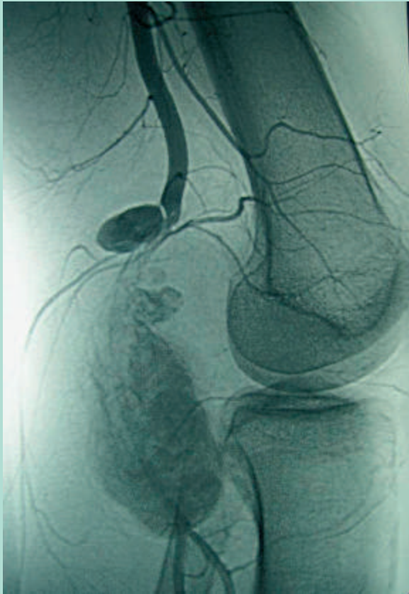
FIGURE 6 : Angio TDM des membres inférieurs montrant deux anévrismes poplités.

Elles sont d'évolution torpide, non inflammatoires et emboligènes dans 10 % des cas.