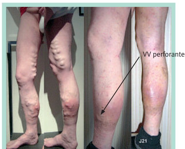
FIGURE 3 : CRO incluant les photo avant-après. Photo prise avant puis après: l'évidence est là !