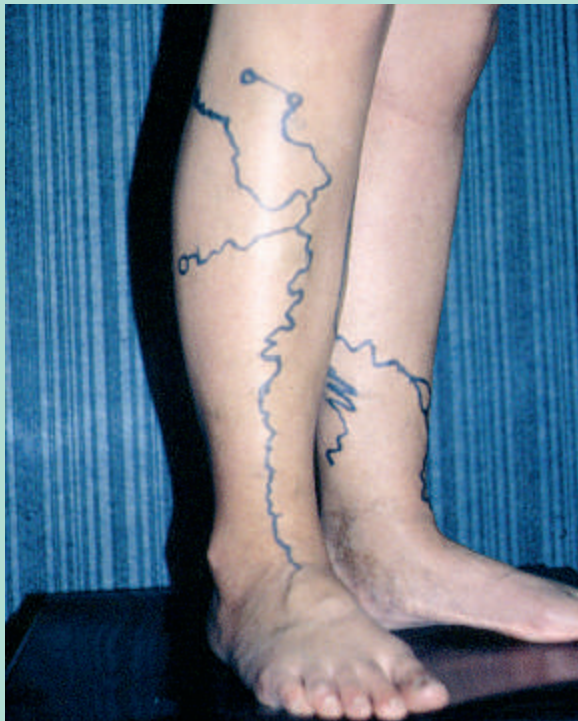
FIGURE 4 : Marquage cutané, ici présclérothérapie.

Marquer tout le réseau variqueux, patient debout, semble judicieux, et surtout indispensable. Les injections, même assistés par la sonde Doppler ou échographique n'étant pas toujours faciles à effectuer ! Il faut pouvoir retrouver facilement le réseau à injecter (ou à phlébectomiser) surtout s'il est tortueux et le patient en décubitus ! Il s'agit de petites varices non-saphènes (vNS) bilatérales tortueuses. Les tronc grande et petite saphènes sont indemnes et sans relation avec ces vNS.