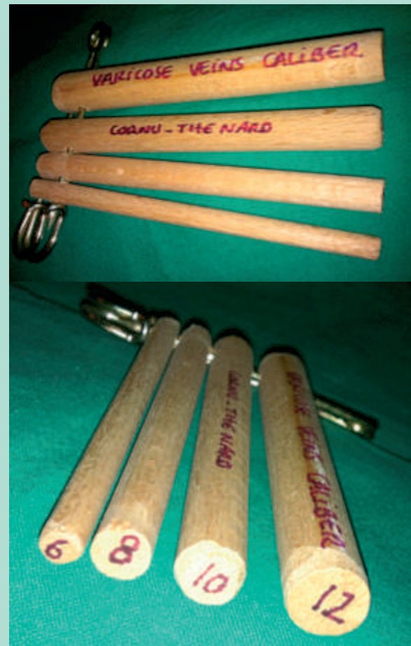
FIGURE 5 : Éléments comparatifs de mesure.

L'évaluation de l'importance du réseau « à faire disparaître » pourrait être établie en utilisant le système VTJP. Toutefois, une solution plus simple existe : le diamètre maximum !