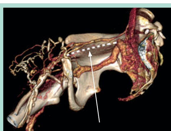
Les pointillés blancs sur cette image de scanner indiquent le trajet oblitéré de la veine iliaque !

Ce dossier informatisé, incluant de nombreux paramètres, peut paraître très lourd. Cependant, il est possible, dans un premier temps et en fonction des objectifs, de ne remplir que certains chapitres.