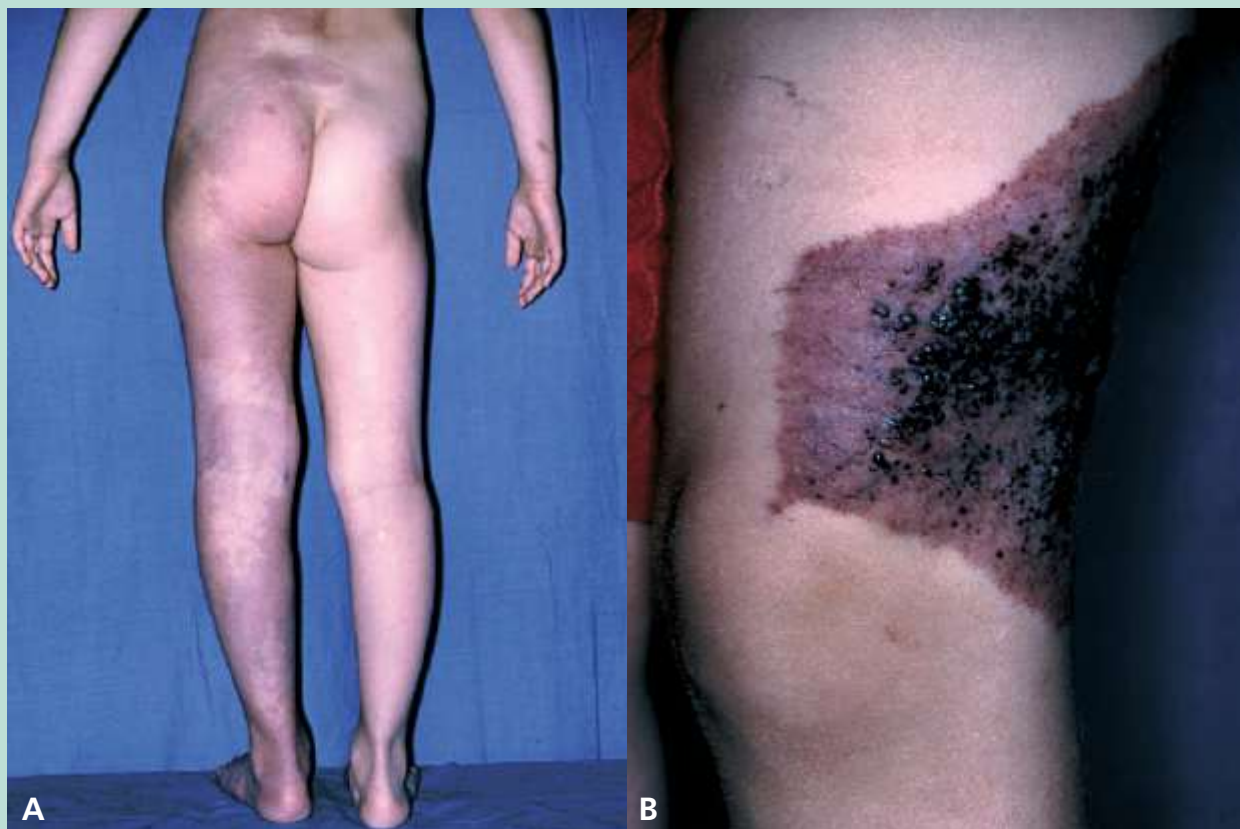
FIGURE 1 : [10].