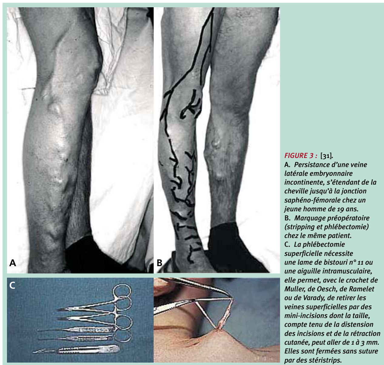
FIGURE 3 : [31].

A. Persistance d'une veine latérale embryonnaire incontinente, s'étendant de la cheville jusqu'à la jonction saphéno-fémorale chez un jeune homme de 19 ans.