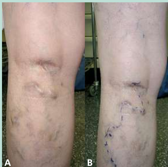
FIGURE 4 : Madame N. A. Branche variqueuse naissant du cavernome poplitée. B. Marquage préopératoire (phlébectomie).

Cependant, les interventions veineuses dont a bénéficié notre patiente, bien que répétées, ont permis de la soulager , d'améliorer significativement son confort , avec une très nette diminution de tous ses symptômes d'insuffisance veineuse (douleurs, lourdeurs des jambes, brûlures, chaleur...).