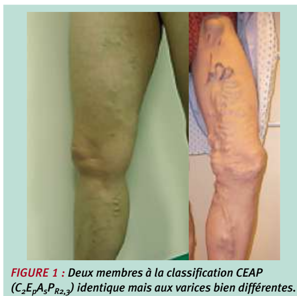
FIGURE 1 : Deux membres à la classification CEAP (C 2 E p A 3 P R2,3 ) identique mais aux varices bien différentes.