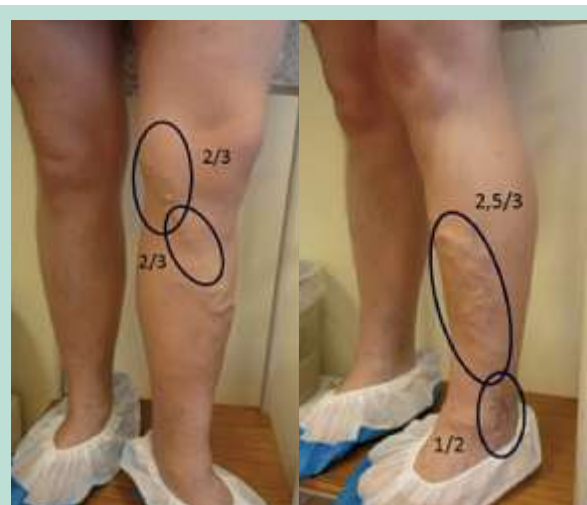
FIGURE 5 : Exemple 1 : calcul du score.