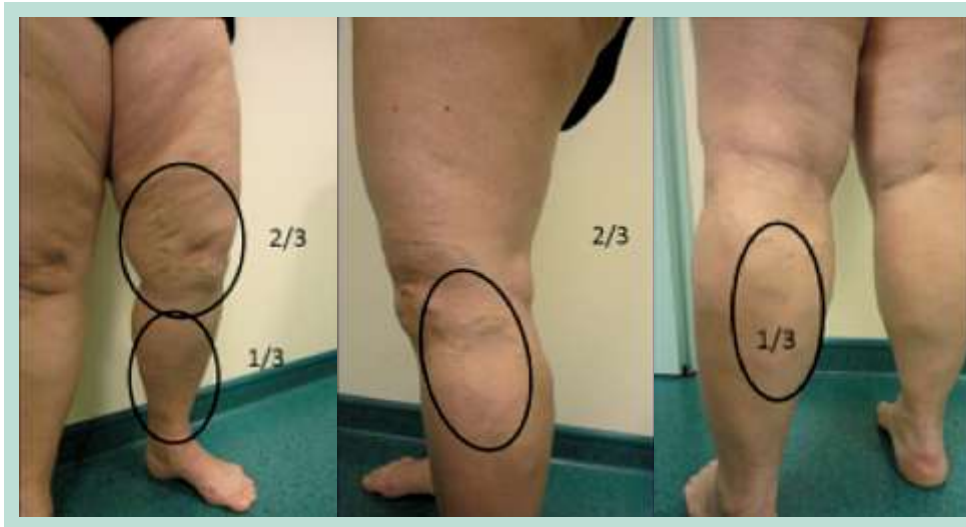
FIGURE 6 : Exemple 2 C_2 6/12 ( 2/3+1/3+1/3+2/3 ) « varices modérées assez étendues ».