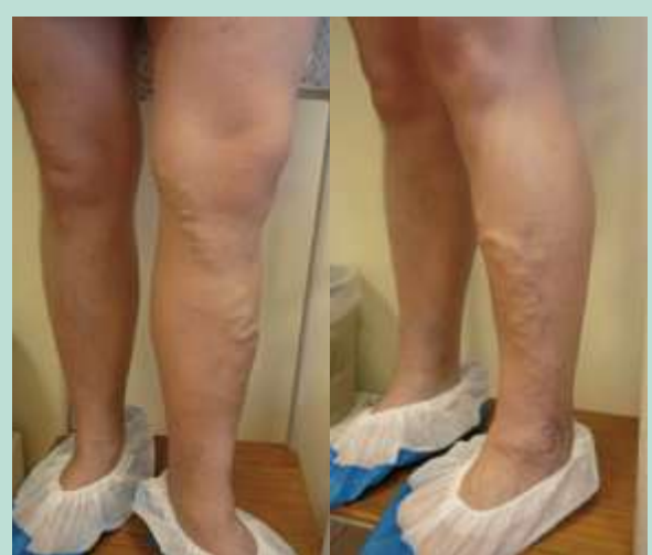
FIGURE 4 : Exemple 1 : appréciation clinique des varices « assez grosses varices, assez étendues ».

Il est la somme des scores des tailles des varices dans les territoires atteints.