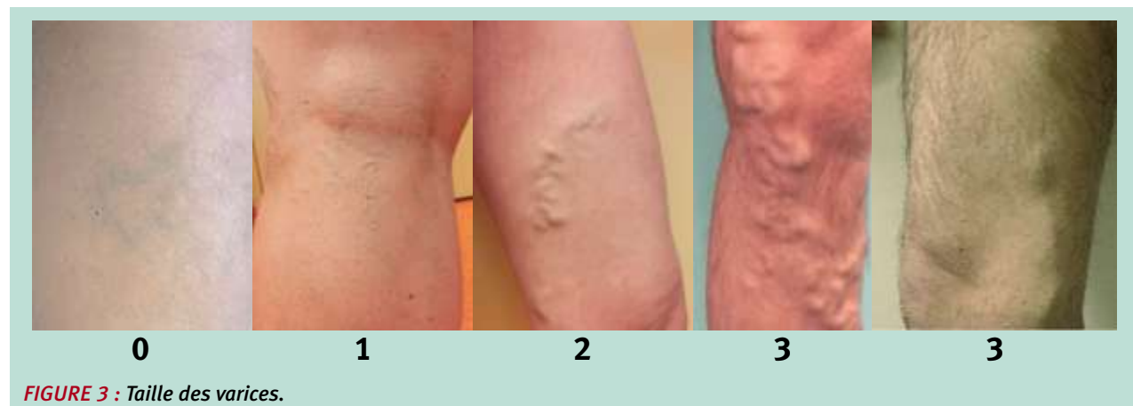
FIGURE 3 : Taille des varices.