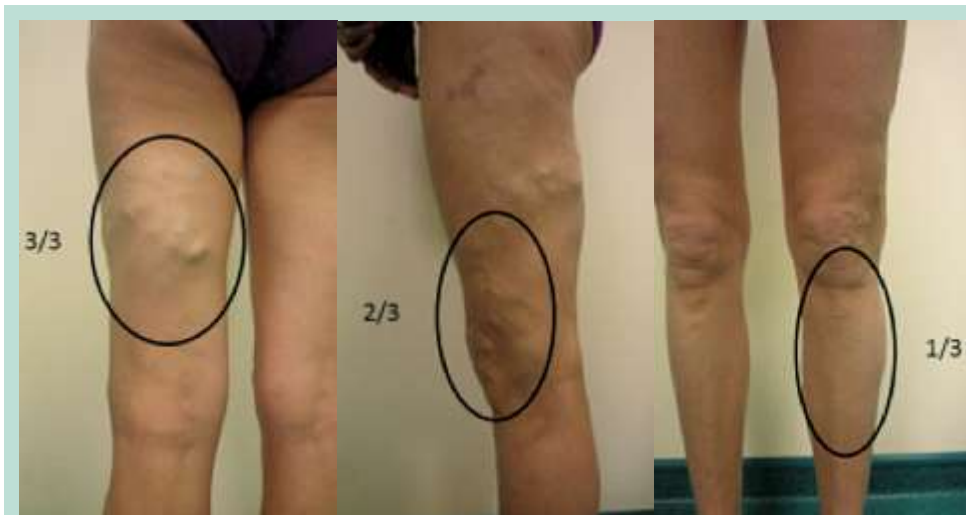
FIGURE 7 : Exemple 3 C_2 6/9 ( 3/3+2/3+1/3 ) « assez grosses varices modérément étendues ».