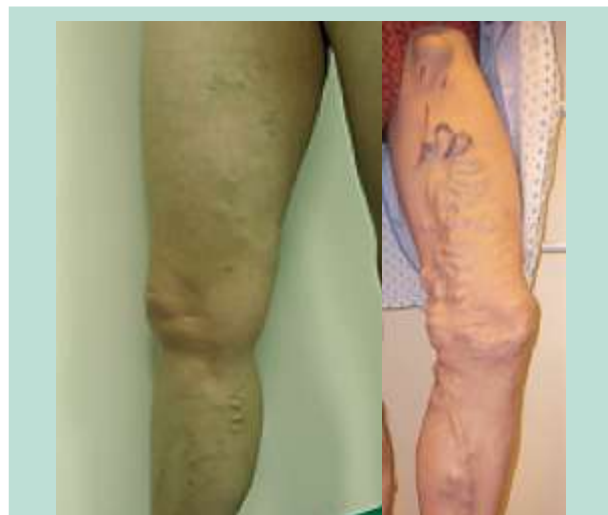
FIGURE 1 : Deux membres à la classification CEAP ( C_2E_pA_3P_{R2,3} ) identique mais aux varices bien différentes.