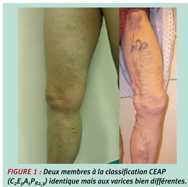
FIGURE 1 : Deux membres à la classification CEAP (C 2 E p A 3 P R2,3 ) identique mais aux varices bien différentes.