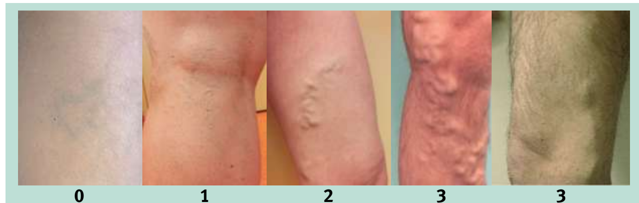
FIGURE 3 : Taille des varices.