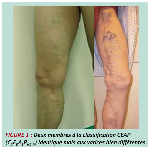
FIGURE 1 : Deux membres à la classification CEAP (C 2 E 3 A 3 P R2,3 ) identique mais aux varices bien différentes.