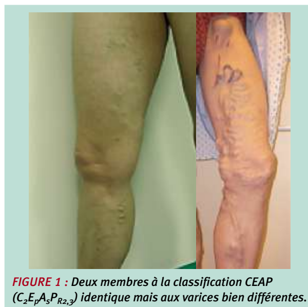
FIGURE 1 : Deux membres à la classification CEAP (C 2 E 3 A 3 P R2,3 ) identique mais aux varices bien différentes.