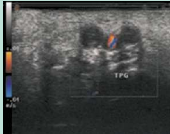
FIGURE 2 : Échographie Doppler de la plante du pied montrant 2 veines tibiales postérieures distales élargies et non compressibles.