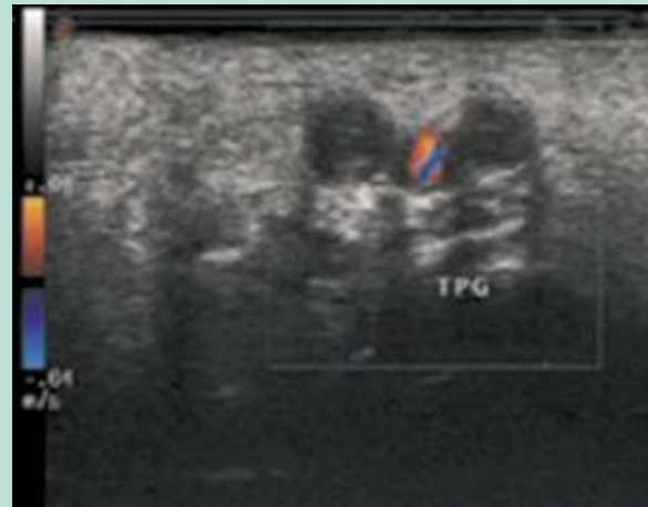
FIGURE 2 : Échographie Doppler de la plante du pied montrant 2 veines tibiales postérieures distales élargies et non compressibles.