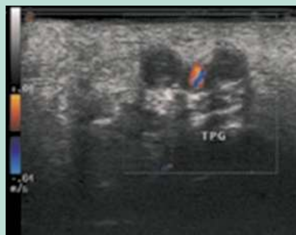
FIGURE 2 : Échographie Doppler de la plante du pied montrant 2 veines tibiales postérieures distales élargies et non compressibles.