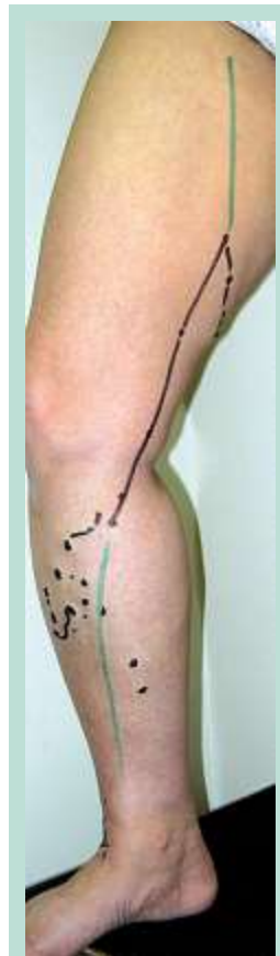
FIGURE 3 : Incontinence de la GVS issue d'un reflux antérograde de la veine de Giacomini.