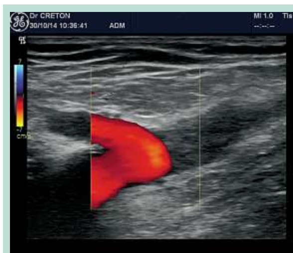
FIGURE 5 : Image écho-Doppler couleur postopératoire d'une TEV (ClosureFast™).

– mais on peut faire ce stripping avec une simple phlébectomie inguinale si les circonstances anatomiques le permettent, pour extérioriser le tronc en-dessous de la crosse, afin de réaliser le stripping habituel de haut en bas à l'aide d'un pin-stripper.