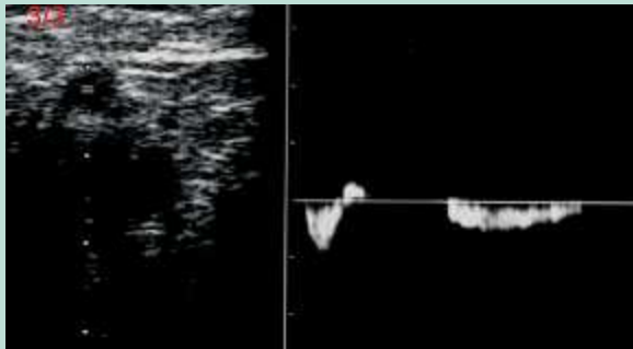
FIGURE 7 : Image échodoppler d'un reflux systolo-diastolique de la JSP.