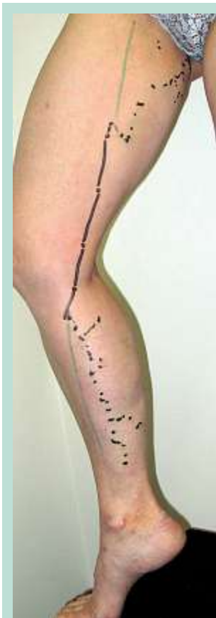
FIGURE 2 : Incontinence de la GVS issue de veines périnéales.