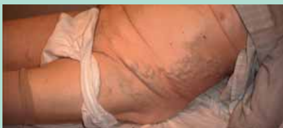
FIGURE 4 : Exemple de MPT avec circulation collatérale après occlusion thrombotique de la veine cave inférieure.