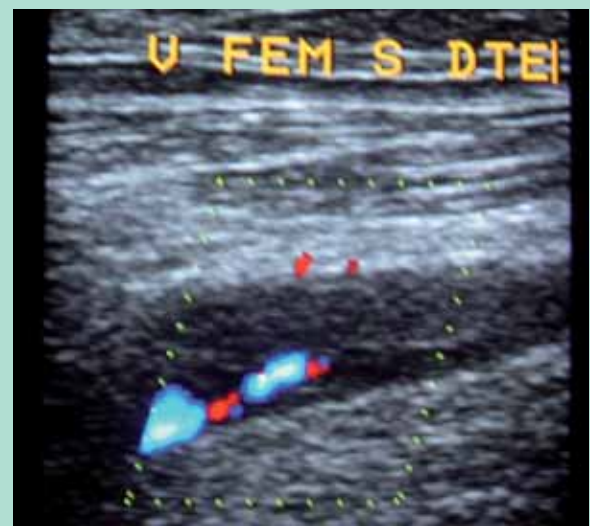
FIGURE 3 : Reperméabilisation partielle de la veine fémorale.

On a montré que le taux d'ulcères veineux continue d'augmenter progressivement au cours des années suivant le diagnostic de TVP avec une incidence cumulée près de 5 % à 10 ans [3].