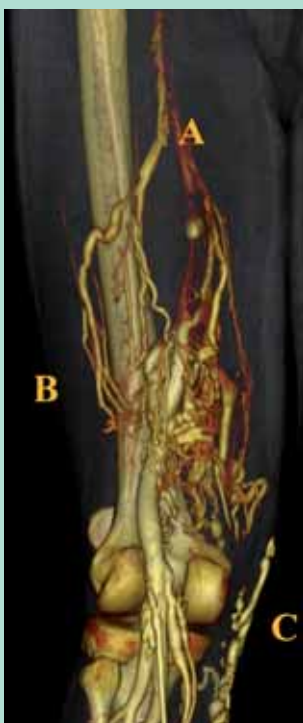
FIGURE 5 : Scanner tridimensionnel d'une maladie post-thrombotique avec en A : occlusion de la veine fémorale après TVP ; B : circulation de suppléance (vicariance) ; C : dilatation des veines distales.

Parallèlement, la formation du thrombus peut endommager les valvules avec une cicatrice fibreuse.