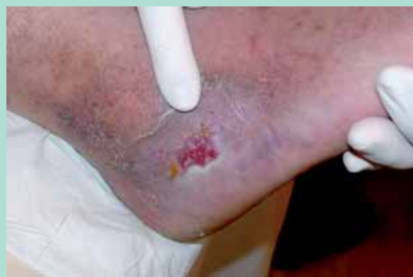
FIGURE 1 : Ulcère post-thrombotique.