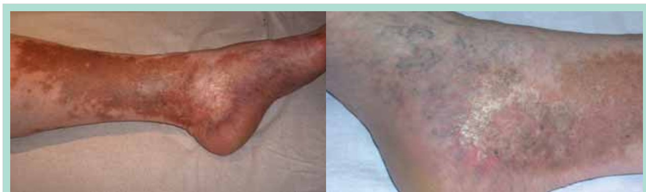
FIGURE 8 : Stade C 4a et b de la classification CEAP.

■ L'écho-Doppler veineux est un examen couramment réalisé chez tout patient consultant pour une maladie veineuse chronique, il peut révéler des anomalies témoignant de la TVP antérieure (épaississement pariétal, cicatrices ou synéchies endoluminales, reflux veineux profond) lorsque l'épisode thrombotique initial n'est pas connu.