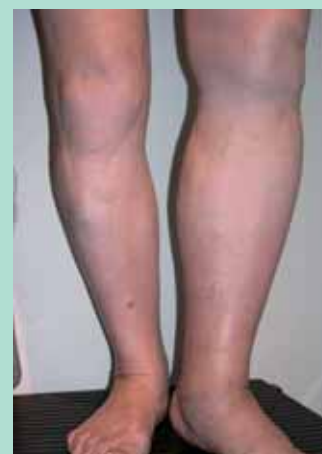
FIGURE 6 : Stade C3 de la classification CEAP.

La classification CEAP permet d'apprécier le stade de la maladie et n'est pas un score de gravité ( Figure 6 , Figure 7 , Figure 8 et Figure 9 ).