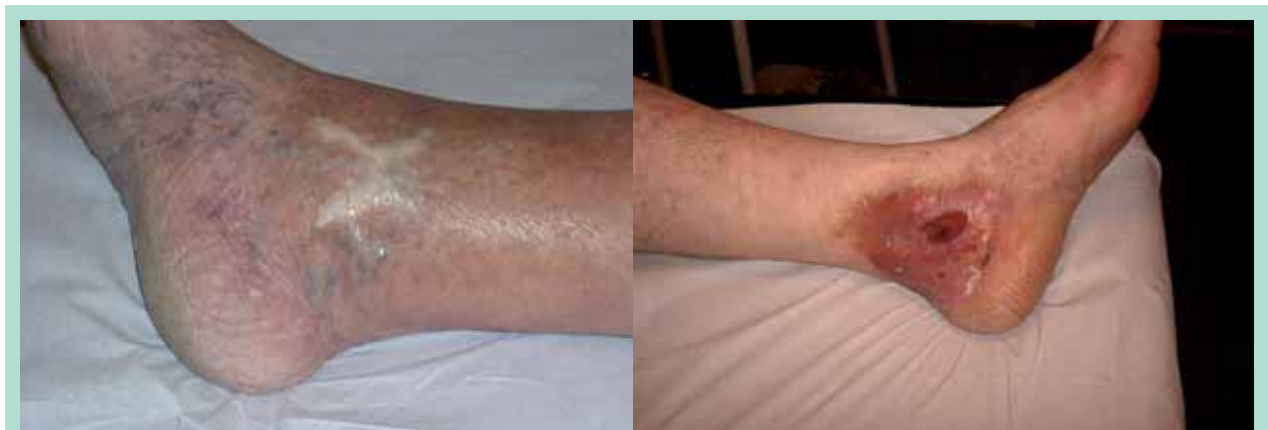
FIGURE 9 : Stades C 5 et C 6 de la classification CEAP.