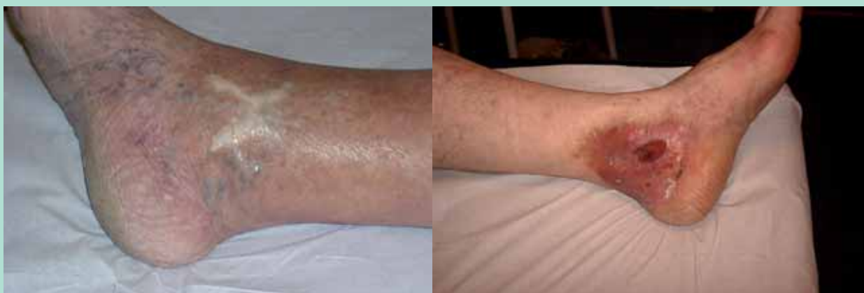
FIGURE 9 : Stades C 5 et C 6 de la classification CEAP.