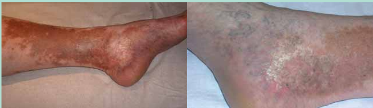
FIGURE 8 : Stade C 4a et b de la classification CEAP.

■ L'écho-Doppler veineux est un examen couramment réalisé chez tout patient consultant pour une maladie veineuse chronique, il peut révéler des anomalies témoignant de la TVP antérieure (épaississement pariétal, cicatrices ou synéchies endoluminales, reflux veineux profond) lorsque l'épisode thrombotique initial n'est pas connu.