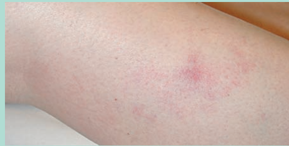
FIGURE 3 : Matting survenu après sclérothérapie à la glycérine chromée. Cette complication a été particulièrement mal vécue par la patiente, dans la mesure où il s'agissait d'une aggravation esthétique et que le thérapeute ne l'avait pas avertie de ce risque.

L'incidence semble plus faible avec la glycérine chromée (9 %) [11, 26] mais elle est par contre beaucoup plus importante avec le STS (57 [27]-92 % [28]).