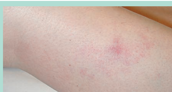
FIGURE 3 : Matting survenu après sclérothérapie à la glycérine chromée. Cette complication a été particulièrement mal vécue par la patiente, dans la mesure où il s'agissait d'une aggravation esthétique et que le thérapeute ne l'avait pas avertie de ce risque.

L'incidence semble plus faible avec la glycérine chromée (9 %) [11, 26] mais elle est par contre beaucoup plus importante avec le STS (57 [27]-92 % [28]).