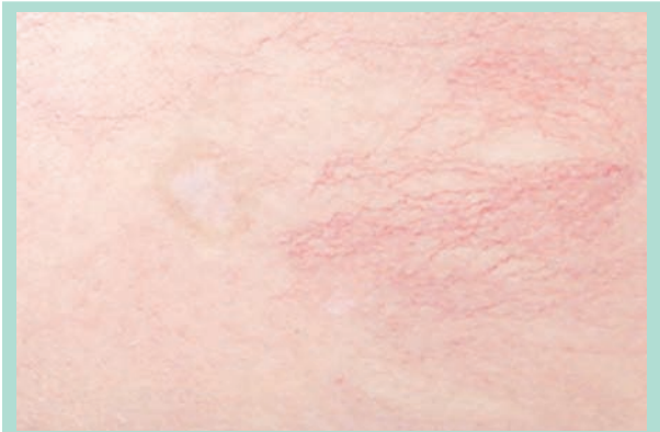
FIGURE 4 : Cicatrice d'ulcère après sclérothérapie à la mousse de polidocanol 0,25 %. Ni la technique d'injection, ni la faible concentration de la mousse n'explique cette ulcération. Elle pourrait être secondaire soit à une injection intra-artériolaire ou par diffusion de l'agent sclérosant à travers une anastomose artério-veineuse.

Dans notre expérience du traitement des télangiectasies, son incidence est de l'ordre de 2-5 %, mais des incidences de 16 jusqu'à 75 % ont été rapportés [4]. Il peut être 2 fois plus fréquent avec la mousse [11, 24].