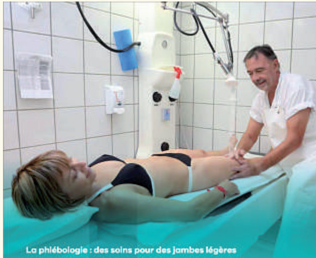
La phlébologie : des soins pour des Jambes légères