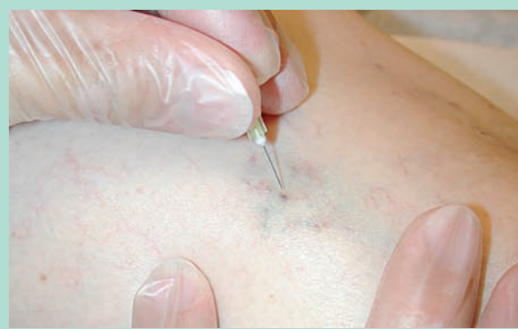
FIGURE 1 : Ponction des microthrombi à l'aiguille fine de 30 G1/2. Ce diamètre est généralement suffisant, il est rare de devoir recourir à une aiguille plus grande.