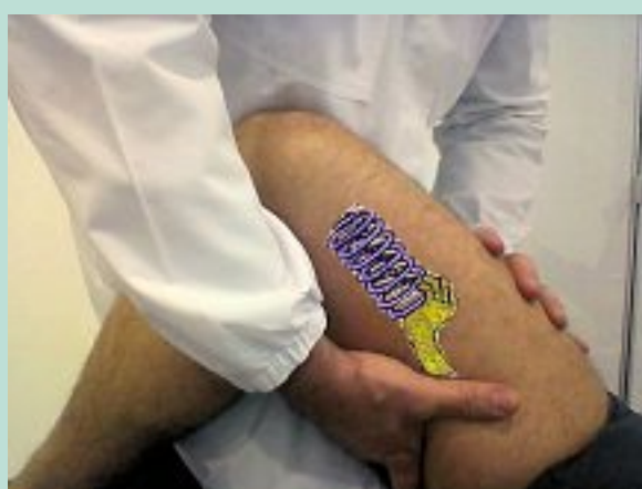
FIGURE 3 : Manœuvre de décongestion sur le quadricèpe : position de départ, les mains sont posées avec les paumes à plat sur la cuisse.