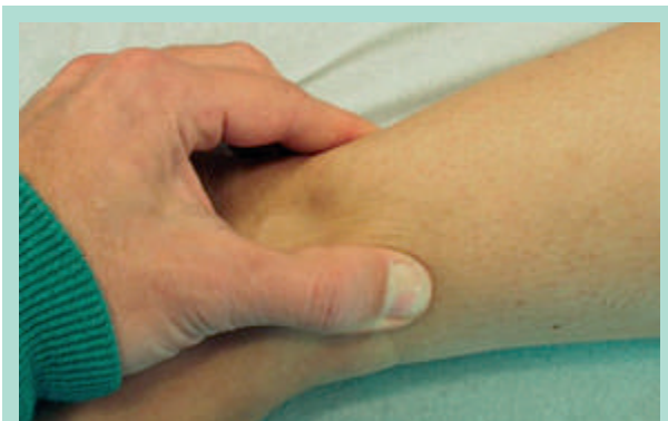
FIGURE 2 : Signe spécifique du lipœdème. En cas de difficulté diagnostique, l'échographie de haute résolution apporte de précieux renseignements.