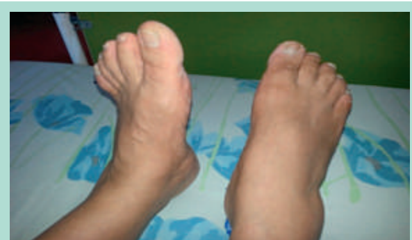
FIGURE 2 : Atteinte du SPE droit.

Avant l'application de la radiofréquence, on injecte du liquide anesthésiant (lidocaïne et sérum physiologique) sur tout le trajet sous-cutané pour augmenter l'épaisseur entre la veine et la peau et ainsi éviter les brûlures cutanées.