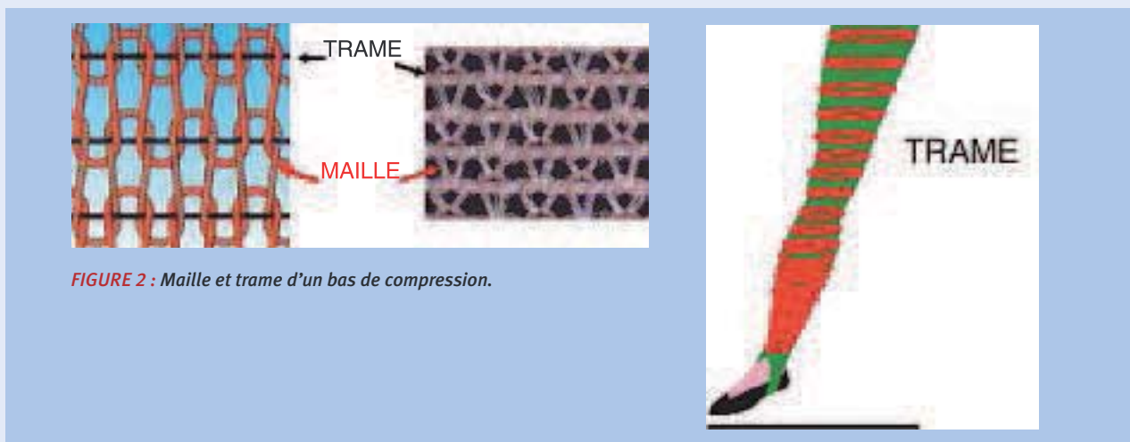
FIGURE 2 : Maille et trame d'un bas de compression.