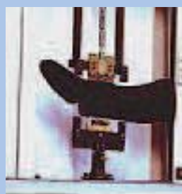
FIGURE 1: Méthode de mesure de la pression in vitro par dynamométrie.