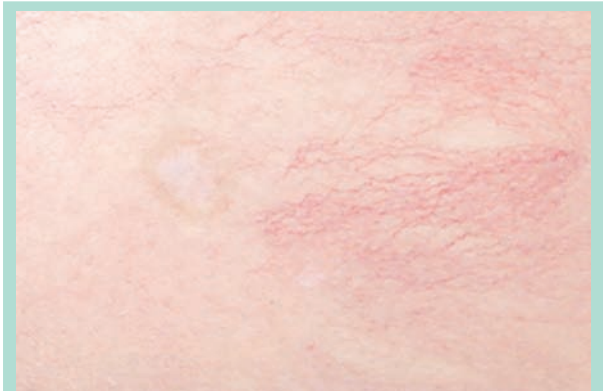
FIGURE 4 : Cicatrice d'ulcère après sclérothérapie à la mousse de polidocanol 0,25 %. Ni la technique d'injection, ni la faible concentration de la mousse n'explique cette ulcération. Elle pourrait être secondaire soit à une injection intra-artériolaire ou par diffusion de l'agent sclérosant à travers une anastomose artério-veineuse.

Dans notre expérience du traitement des télangiectasies, son incidence est de l'ordre de 2-5 %, mais des incidences de 16 jusqu'à 75 % ont été rapportés [4]. Il peut être 2 fois plus fréquent avec la mousse [11, 24].