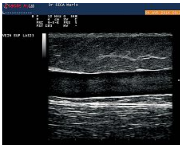
FIGURE 1 : Coupe longitudinale d'un axe saphénien en mode B.

Aujourd'hui, une des directions de la recherche en imagerie est de travailler sur les techniques de reconstruction tridimensionnelle (appelées également techniques en 3 dimensions ou en 3D) : de les rendre plus précises, plus automatiques, plus dédiées à la thérapeutique.