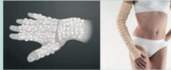
FIGURE 6 : Gantelet et manchon Mobiderm®.

La réussite du traitement sera jugée sur la transformation de l'œdème, pour passer d'un stade « œdème induré » à un stade « plus souple ».