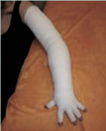
FIGURE 4 : Bandage multibande.