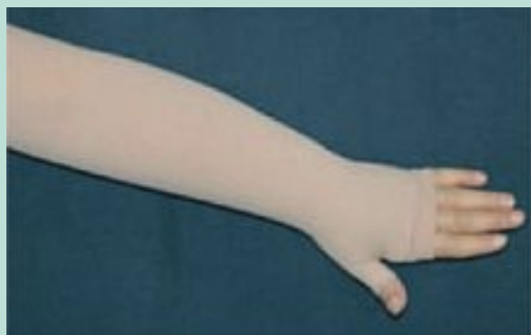
FIGURE 8 : Manchon avec mitaine attenante.

Ainsi, non seulement le Mobiderm® agirait par un effet thixotrope (transformation d'un état de gel en état de liquide) modifiant ainsi l'œdème, mais en augmentant également les possibilités de circulation.