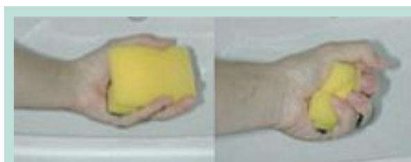
FIGURE 3 : Simulation de l'efficacité du drainage lymphatique manuel.

Les séances de kinésithérapie ne doivent pas durer moins de 30 minutes [17, 18, 19, 24].