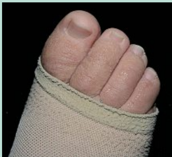
FIGURE 5 : Aggravation d'un lymphœdème des orteils par l'utilisation de bas de compression pied ouvert : papillomatose et vésicules (suintantes) des orteils.

Il est parfois nécessaire d'utiliser des dispositifs d'enfilage. Dans la plupart des cas, les compressions sont réalisées sur mesure par un orthésiste ou un pharmacien orthopédiste et sont remplacées tous les 3 à 4 mois.