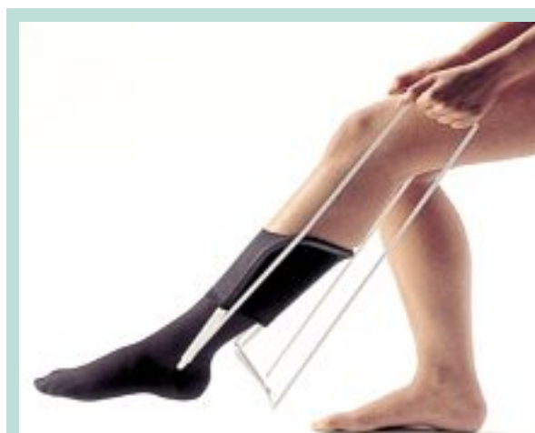
FIGURE 4 : Enfile-bas rigide.

Dans une étude publiée en 2006 [1] et réalisée chez 138 patients hospitalisés d'âge moyen 82,5 ans dont l'insuffisance veineuse était documentée à l'écho-Doppler, le port d'une compression élastique était nécessaire.