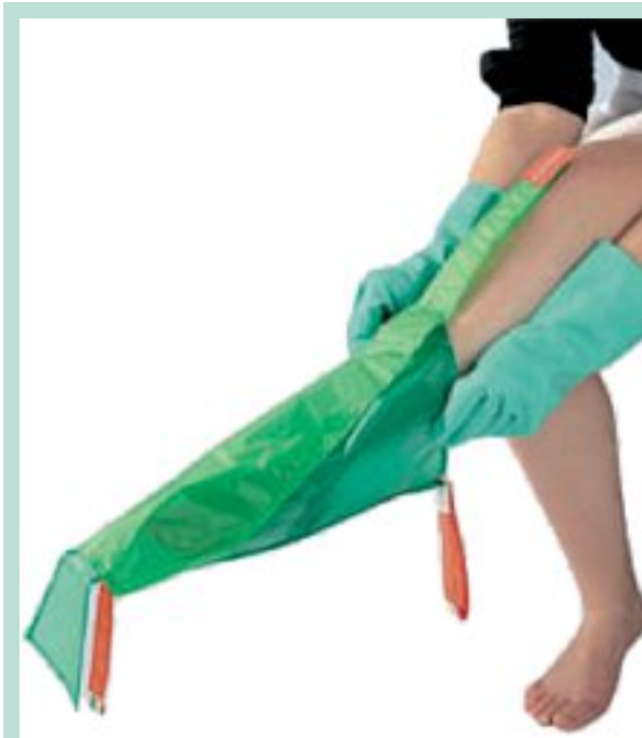
FIGURE 5 : Enfile-bas souple.