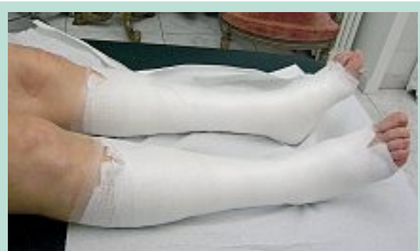
FIGURE 7 : Pose de Varolast®.

Mais une des meilleures solutions demeure sans doute la classique superposition de deux bas de classe II ou I+II, pour réaliser une compression forte III ou IV.