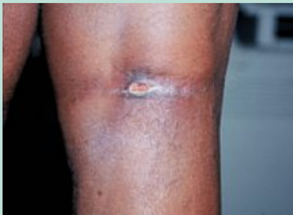
FIGURE 8 : Nécrose au niveau du creux poplité, liée à une chaussette trop serrée chez un sujet âgé.