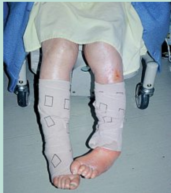
FIGURE 9 : Exemple d'un bandage chez un patient hospitalisé.

Les situations rencontrées sont multiples et nécessitent le plus souvent une adaptation des dispositifs avant de passer à la compression élastique classique. Les situations rencontrées sont multiples et nécessitent le plus souvent une adaptation des dispositifs.