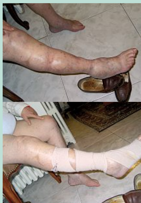
FIGURE 10 : Bande à allongement long, posée par le patient lui-même.