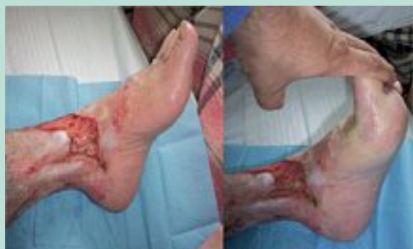
FIGURE 3 : Le blocage de l'articulation tibio-tarsienne.

Ces situations favorisent la stase veineuse, œdème et troubles trophiques et majore l'incidence de la maladie thromboembolique.