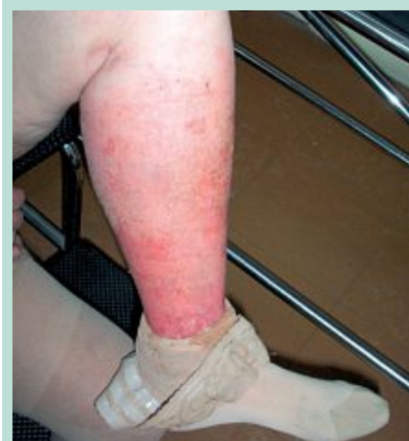
FIGURE 6 : Œdème exsudatif.

Le remplacement du bas par un manchon en néoprène, inextensible dont la pression est ajustable au moyen de fermetures Velcro, peut également être une solution pratique.