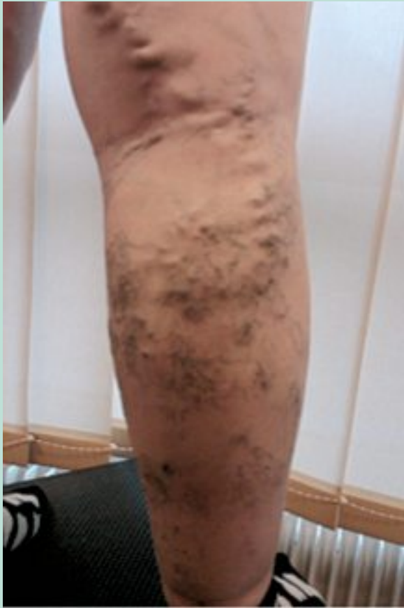
FIGURE 2 : Varice non systématisée pseudo-angiomateuse.