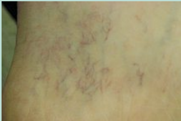
FIGURE 4 : Début de couronne phlébectasique de la région rétro-malléolaire interne.

Toutefois, le moindre traumatisme sur une jambe œdématisée peut aboutir à une plaie chronique. Cet ulcère ne surviendra que quelques dizaine d'années plus tard, en particulier s'il existe le signe précurseur qu'est la corona phlebectatica [31] ( Figure 4 ).