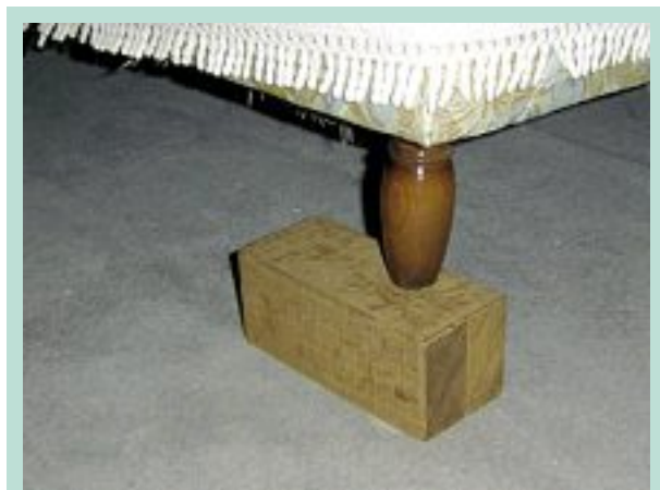
FIGURE 5 : Une simple cale en bois de 10 cm suffit.