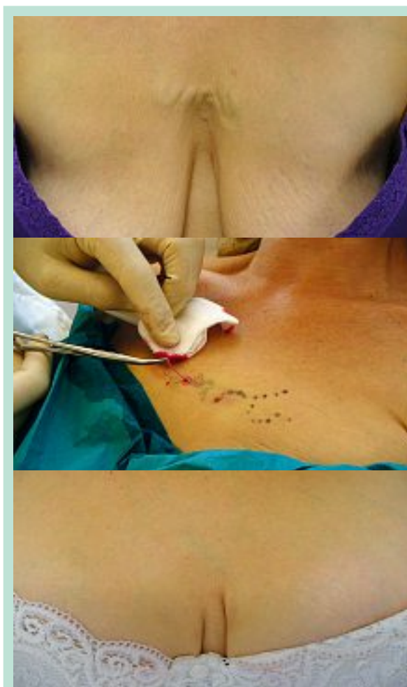
FIGURE 3 : Phlébectomie d'une veine du tronc.

Très visible chez certains patients, le réseau veineux des MS peut présenter des dilatations pathologiques segmentaires.