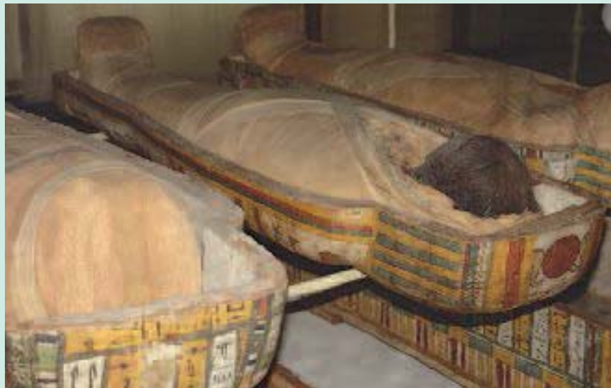
FIGURE 6 : Mummies du Musée Egyptien de Turin.